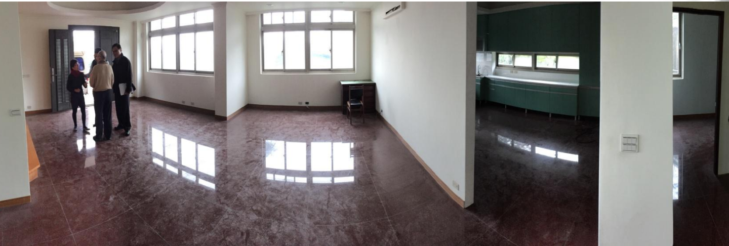
物件照片(一樓、房間、和室、廚房)